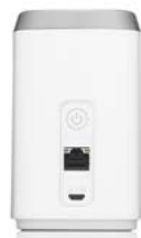
Modem ZyXel LTE4506 – zadní strana